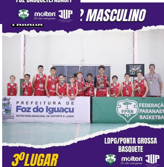
LDPG/PONTA GROSSA BASQUETE